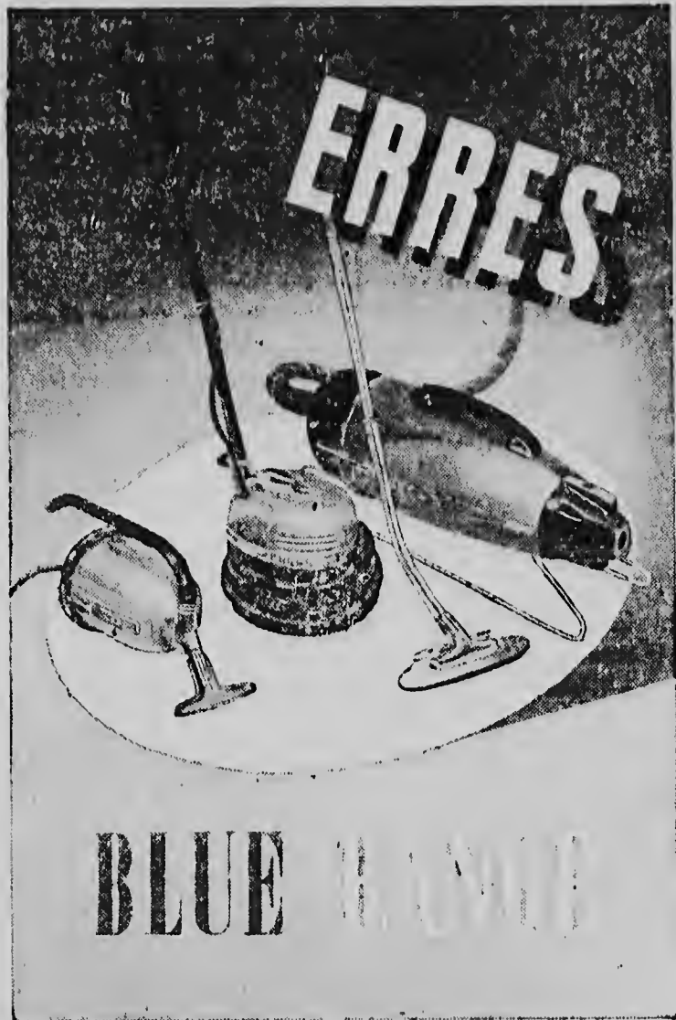
MARIO S. ARENDS INC., ARUBA